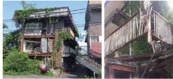
適正な維持管理が行われなくなったマンションの例